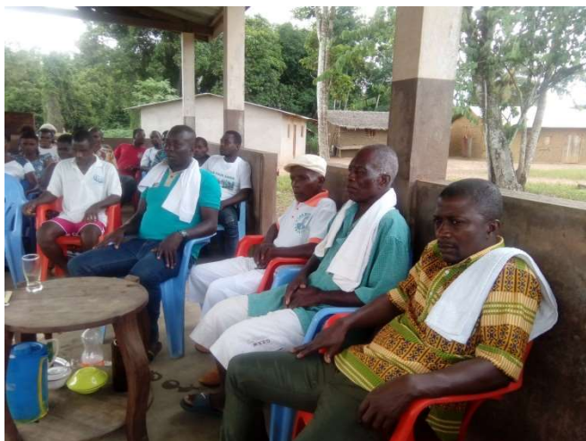
Une vue des populations écoutant le bien fondé du projet