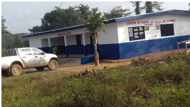
Une vue du centre de santé de DJIHIMBO

Ces centres de santé sont constitués de :