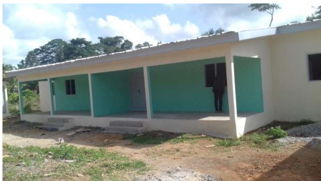
Vue façade de la villa jumelée